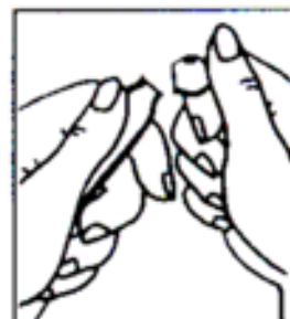
Abb. 2 Ampullenhals vom Punkt wegbrechen.

Bricanyl 0,5mg sollte nicht mit alkalischen Lösungen (Lösungen mit einem pH-Wert > 7 ) vermischt werden.