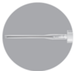
Nadel 1 - 38 mm