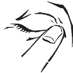
Abbildung 1 Abbildung 2 Abbildung 3 Abbildung 4

Nach Möglichkeit sollten Sie Allergodil regelmäßig anwenden, bis Ihre Beschwerden verschwunden sind. Falls Sie die Anwendung von Allergodil unterbrechen, können Ihre Beschwerden erneut auftreten.