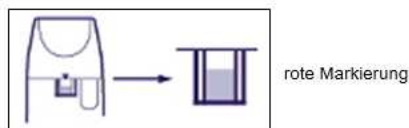
leer leer (Abb. 5)

Das Geräusch, das beim Schütteln des Turbohalers auftritt, wird durch das Trockenmittel verursacht und gibt keine Auskunft über den Füllstand des Turbohaler®. Hinweis: Lassen Sie sich vom Arzt gründlich in den korrekten Gebrauch von Pulmicort Turbohaler 400 µg einweisen, um eine falsche Anwendung zu vermeiden. Kinder sollten dieses Arzneimittel nur unter Aufsicht eines Erwachsenen anwenden. Über die Dauer der Anwendung entscheidet der behandelnde Arzt. Pulmicort Turbohaler 400 µg ist ein Arzneimittel zur Langzeitbehandlung des Asthmas.